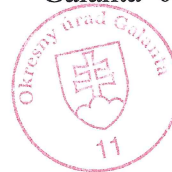
Foto rozhodnutie sa stalo právoplatným dňa ... 26. 08. 2023 v Galante dňa ...